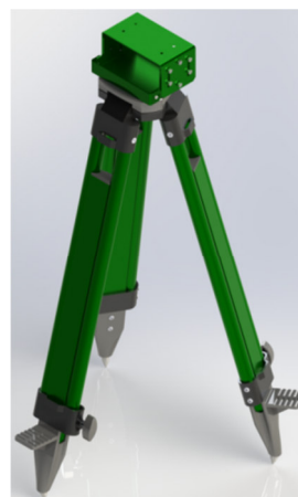
б) штатив в сборе