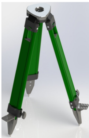
а) штатив в рабочем положении без кронштейна

Общий вид штатива приведен на рисунке 1.